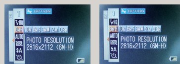
AJUSTES DE LA CÁMARA